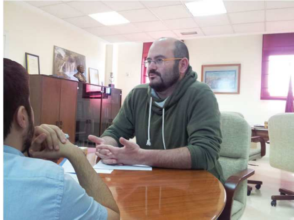
Diversas reuniones con la Concejalía de Moratalaz