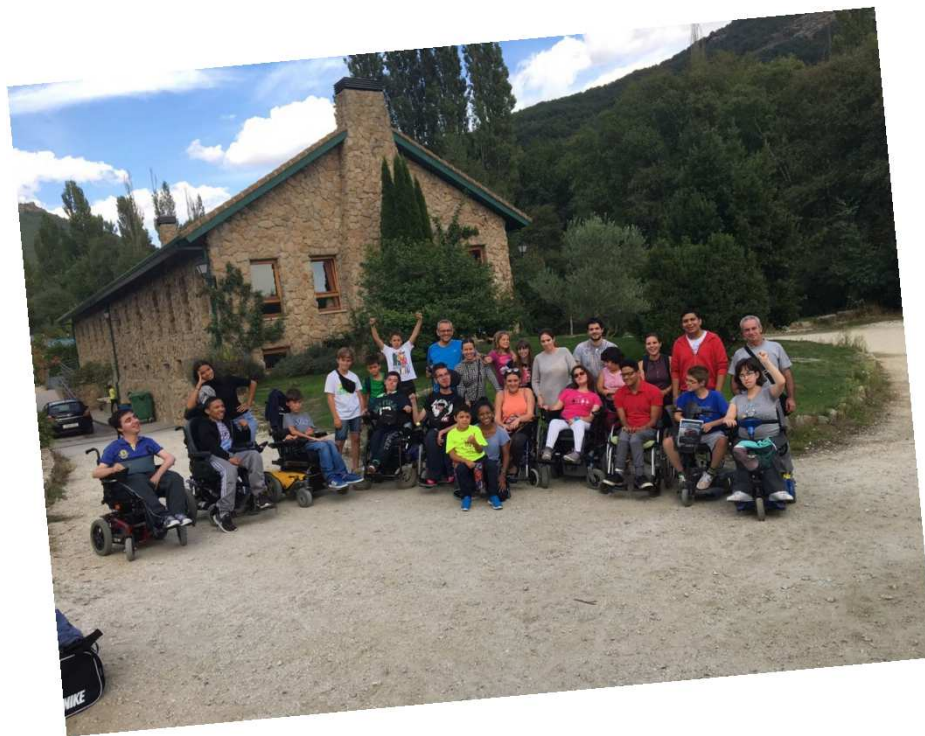
23, 24 y 25 SEPTIEMBRE Fin de Semana de Respiro Familiar 2016 Albergue "Los Abedules" Bustarviejo-Madrid